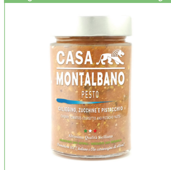
Image Prodotto / Product Image

Organismo di controllo autorizzato dal Mipaaff IT-BIO-012 Operatore controllato n. 4353